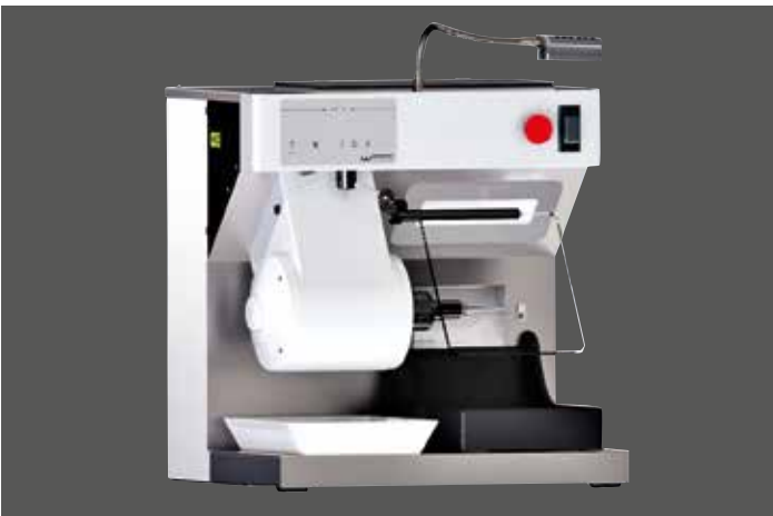
WP-Ex 10 II mit Sonderzubehör Tageslicht-LED-Spot