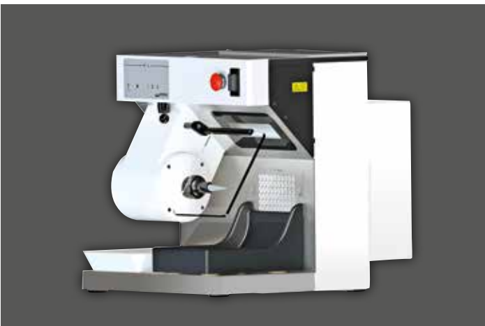
WP-Ex 10 II mit Sonderzubehör Ansaugschutzgitter