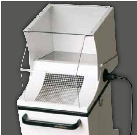
Timobil inkl. Zubehör Saughaube