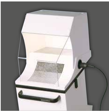
Timobil inkl. Zubehör Saughaube mit Beleuchtung