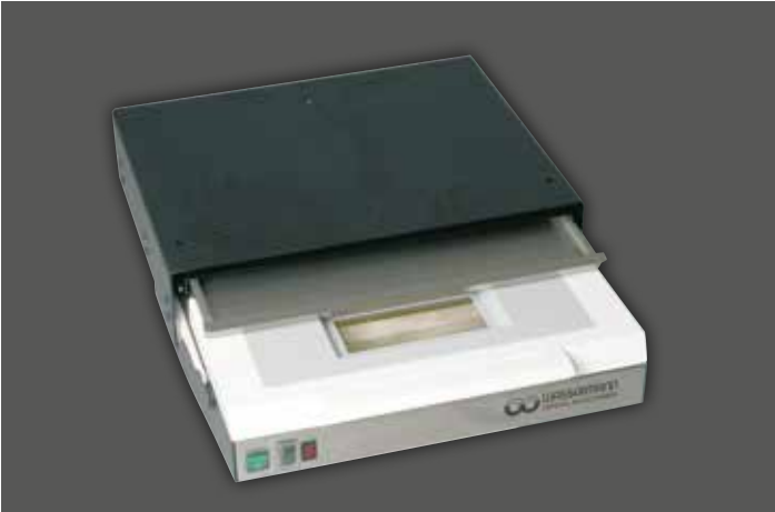
LSG-02 mit Zwischenschublade