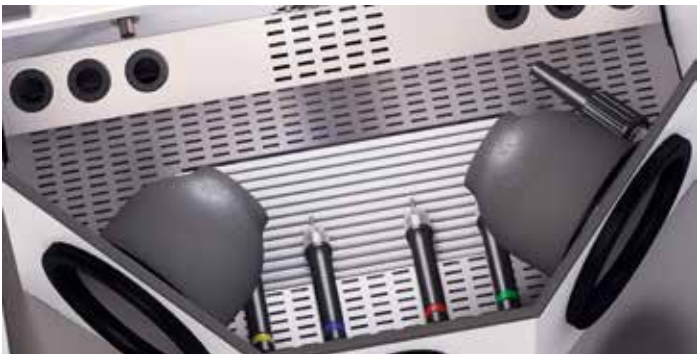
Ergonomische Strahlgriffel und separate Ausblasdüse