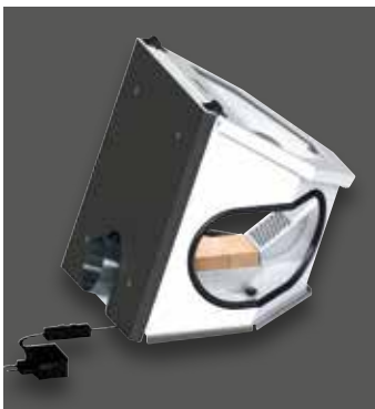
Absaug-Box Compact III, Standardausführung mit seitlichen Eingriffsöffnungen, geräumigem Innenvolumen und einem umsetzbaren Absaugstutzen (Montagemöglichkeiten vorne und hinten)