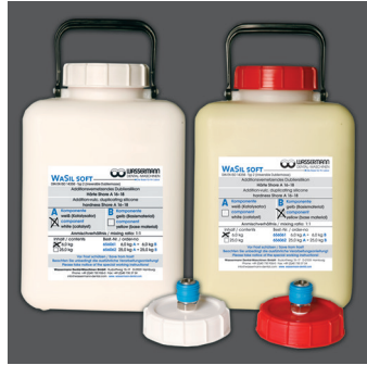
WaSil soft, Härte Shore A: 16-18, 6 kg Gebinde