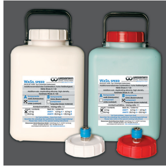
WaSil speed, Härte Shore A: > 24, 6 kg Gebinde